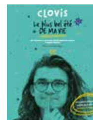
Clovis, Le plus bel été de ma vie Caroline Allard et coll.