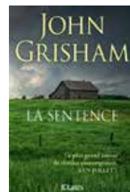
La sentence John Grisham