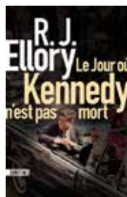
Le Jour où Kennedy n'est pas mort R.J. Ellory