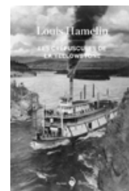
Les crépuscules de la Yellowstone Louis Hamelin