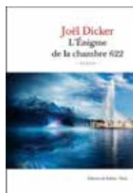
L'Énigme de la chambre 622 Joël Dicker