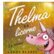
Thelma la licorne - Le retour Aaron Blabey