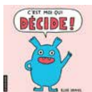
C'est moi qui décide ! Élise Gravel