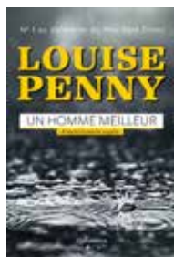
Un homme meilleur Louise Penny